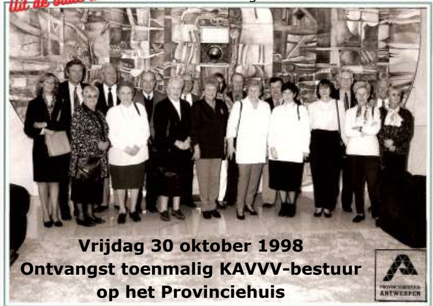
Vrijdag 30 oktober 1998 Ontvangst toenmalig KAVVV-bestuur op het Provinciehuis